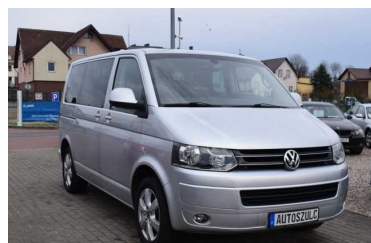
utoSzulc BEZPIECZNY ZAKUP ROK GWARANCJI